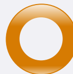
100% MSCI Emerging Markets in USD