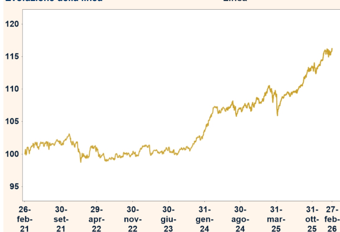
Evoluzione della linea